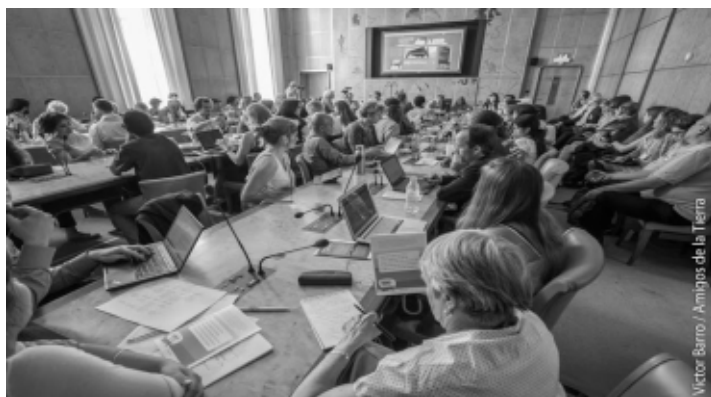
Conferencia paralela del CETIM y de la Campaña mundial

8. Proteger el proceso de la influencia de las ETNs y tomar medidas para que las organizaciones de la sociedad civil, puedan participar de manera efectiva en el proceso.