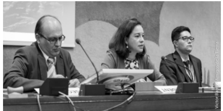
La Embajadora de Ecuador, la Sra. María Fernanda Espinosa, en sus primeras palabras como Presidente-Relatora.

El primer panel propuesto se refirió a los principios en los cuales debería basarse el futuro tratado. Luego se propusieron dos paneles sobre el alcance del instrumento, uno sobre el problema de los actores que serían focalizados (empresas transnacionales o todas las em-