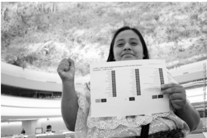
Una delegada de la Campaña mundial después de la victoria al Consejo de los derechos humanos en junio de 2014