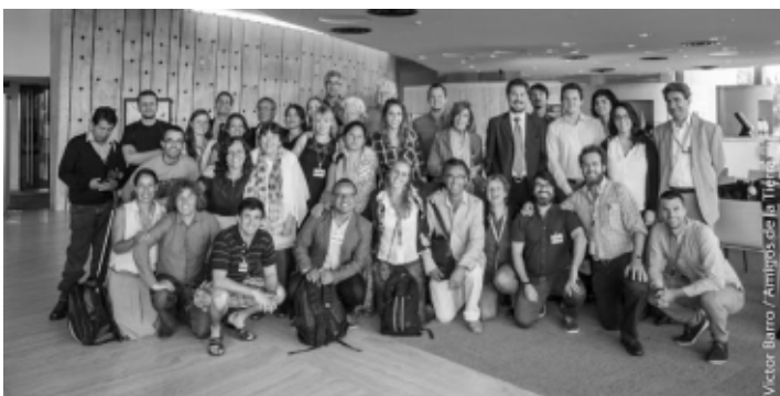
Delegados del CETIM y de la Campaña Mundial durante el grupo de trabajo en el Palais des Nations.

timas y comunidades afectadas del mundo entero, al cual el CETIM presta su apoyo para la participación en los trabajos del Grupo de trabajo intergubernamental. Una cincuentena de delegados de la Campaña mundial se desplazó a Ginebra. Organizamos conjuntamente una semana de movilización contra la impunidad de las ETNs, que culminó en una gran manifestación el miércoles por la noche y una presencia permanente a lo largo de la semana en la plaza de las Na-