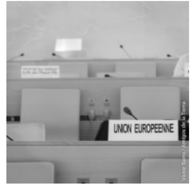
La sede vacía de la Union Europea en la reunion del grupo de trabajo

Sería injusto lanzar la piedra únicamente a la Unión Europea ya que si bien algunos países occidentales, como Suiza, participaron como "observadores", la mayoría de ellos simplemente boicotearon la sesión. Si la oposición implacable de los países del Norte al proceso no fue una sorpresa, siempre es preocupante de constatar que estos mismos países que son tan proactivos cuando se trata de promover los intereses de las ETNs negociando nuevos tratados de libre comercio e inversión, son tan reacios cuando se trata de pro-