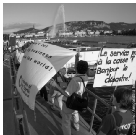
Marcha contra TiSA y la impunidad de las ETNs

Mientras tantos, el informe de la primera sesión se presentará al Consejo de derechos humanos en junio de 2016 y un segundo periodo de sesión del Grupo de trabajo intergubernamental se llevará a cabo, en marzo de 2016. En la conclusión del informe, la Embajadora de Ecuador manifestó su intención de organizar consultas informales en el período intersesional y de trabajar en la elaboración de un nuevo programa de trabajo que se presentará y se discutirá en la próxima sesión. Por lo tanto, hasta la reunión de 2016.