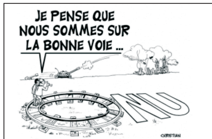
Pienso que estamos bien encaminados... Dibujo de Christian relativo a la guerra en el Medio Oriente. http://chris.blog.mongeraie.com

del desarrollo práctico del examen, etc.) en espera de respuesta. El Consejo deberá tomar las decisiones concernientes en función de las conclusiones de su grupo de trabajo.