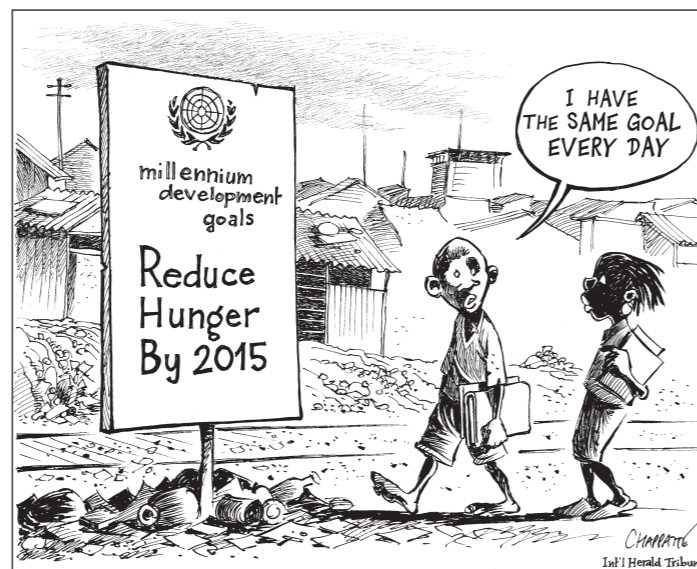
Objectif du Millénaire pour le développement Réduire la faim pour 2015. « Chaque jour j'ai ce même objectif. »

Lors de sa 6 ème session (janvier 2011), le Comité consultatif a débattu de l'étude préliminaire sur cette question 20 , examinant entre autres les causes