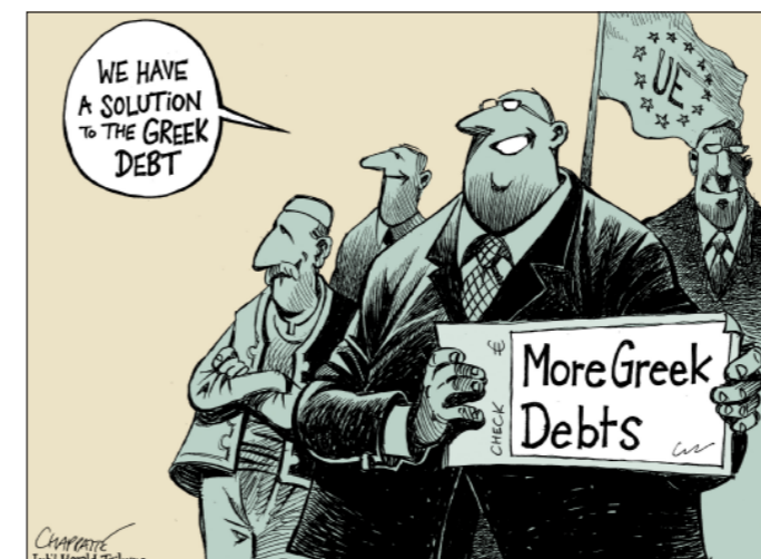
"Tenemos una solución para la deuda griega... Más deudas griegas" Copyright Chappatte in www.globecartoon.com

Pero en realidad los bancos no han corrido grandes riesgos haciendo préstamos a los Estados, ya que sabían que en caso de graves problemas las instituciones europeas (Comisión Europea y BCE) y el FMI vendrían en su ayuda. Además, de paso, han obtenido jugosos beneficios obteniendo préstamos de la BCE a un tipo de interés del 1% y concediendo a los Estados préstamos a tipos largamente superiores: 2% a Alemania, 6% a Italia o a España. En cuanto a Grecia, que a principios de 2009 obtenía créditos a un tipo de interés inferior a 1%, y seis meses más tarde a 5%, se ve obligada hoy en día a aceptar créditos a un tipo de interés del 15%.