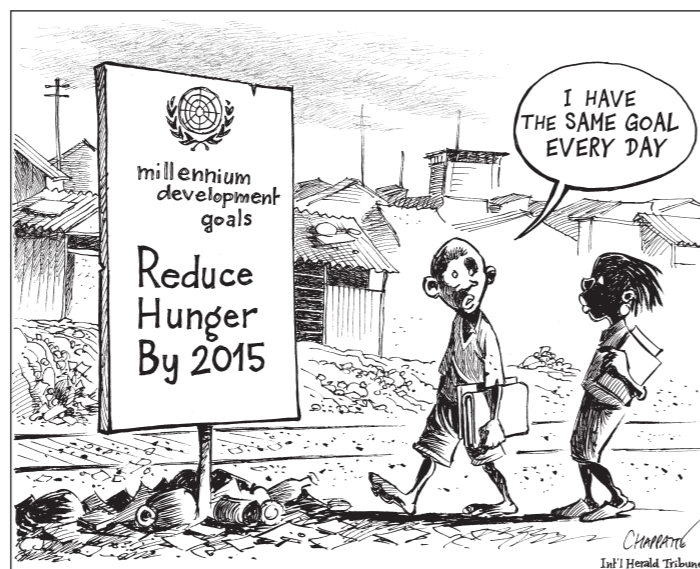
Objetivo de desarrollo del Milenio Reducir el hambre por 2015. “Cada día tengo este objetivo” Copyrights Chappatte in http://www.globecartoon.com/

El Comité Asesor ha presentado un estudio preliminar a la 13ª reunión del CoDH (marzo de 2010) 17 . Lo esencial de este estudio se refiere a las discriminaciones de los paisanos-as. La Declaración de LVC sobre los derechos de los paisanos-as figura en anexo al estudio. Los expertos de la ONU piensan, como nosotros, que el estudio es un instrumento importante en la lucha contra las violaciones de los derechos humanos de las que son víctimas los paisanos-as. Por ello, han propuesto al CoDH que haga un estudio en profundidad sobre el papel e importancia de un instrumento jurídico internacional sobre los derechos de los paisanos 18 . Ciertos Estados occidentales se han opuesto de nuevo, argumentando que los paisanos no constituyen un grupo vulnerable. Sin embargo, tras negociaciones, han aceptado que el estudio en cuestión se refiera a todas las personas que viven en zonas rurales 19 . Por ello, la palabra “paisano-a” no figura en el proyecto de resolución. A pesar de todo, esto no constituye un hándicap, sino al contrario. Si bien los paisanos-as constituyen la mayoría de la población rural, los trabajadores agrícolas, los paisanos-as sin tierra, los pastores, los pescadores, la mano de obra, etc. son igualmente víctimas de graves violaciones de los derechos humanos. Por lo tanto, será de toda justicia la inclusión de estos grupos en el futuro convenio. Por otra parte, como ya hemos dicho, la definición de “paisano-a” que figura en la Declaración de LVC sobre