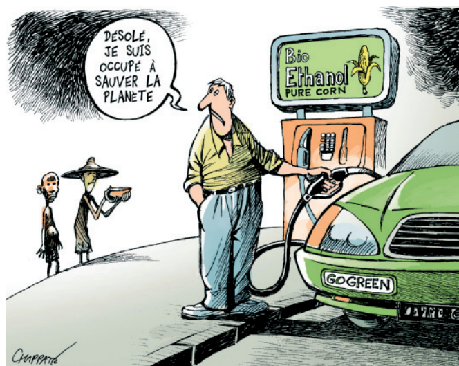
“Lo siento, pero estoy salvando la planeta” Copyright Chappatte in www.globecartoon.com

Precio: CHF 22.50 / 15 €, 196 p., ISBN: 978-2-84950-16-10, edición del CETRI (Bélgica) / Syllepse (Francia), 2008. Pedir ante el CETIM.