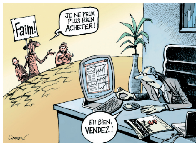
“Tengo hambre. No puedo comprar nada.” “Entonces, que vendan” Copyright Chappatte in www.globecartoon.com

1 Ver el informe de la organización GRAIN, “Making a killing from hunger”, abril de 2008.